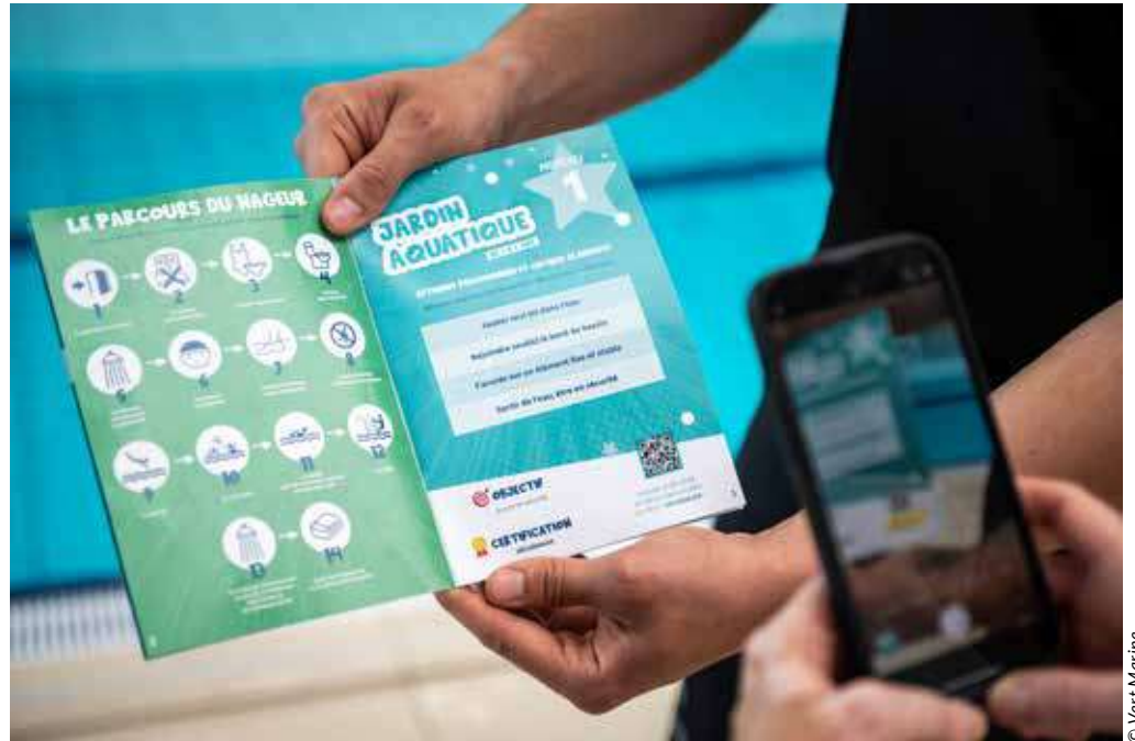
Le carnet de natation de l'enfant est au centre du triangle maître-nageur-parent-enfant.