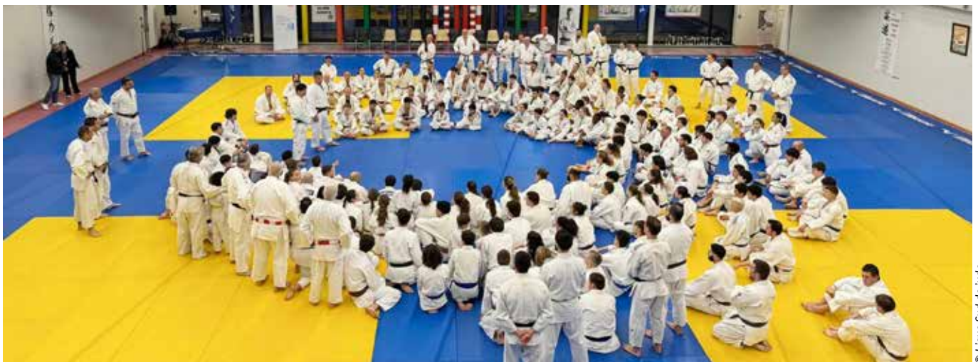
La Ligue Sud-PACA de judo entend développer la pratique auprès d'un public de plus en plus large.

Nous bénéficions d'un soutien important au niveau fédéral. Notamment pour les 1 000 Dojos, France Judo est à nos côtés. Concernant les collectivités, il y a un peu tout à faire. L'avantage, c'est que je suis désormais beaucoup plus disponible pour rencontrer les uns et les autres. Depuis le 1 er juillet, je suis en cessation d'activité, ce qui me permet de me consacrer totalement au travail mené à la tête de la Ligue.