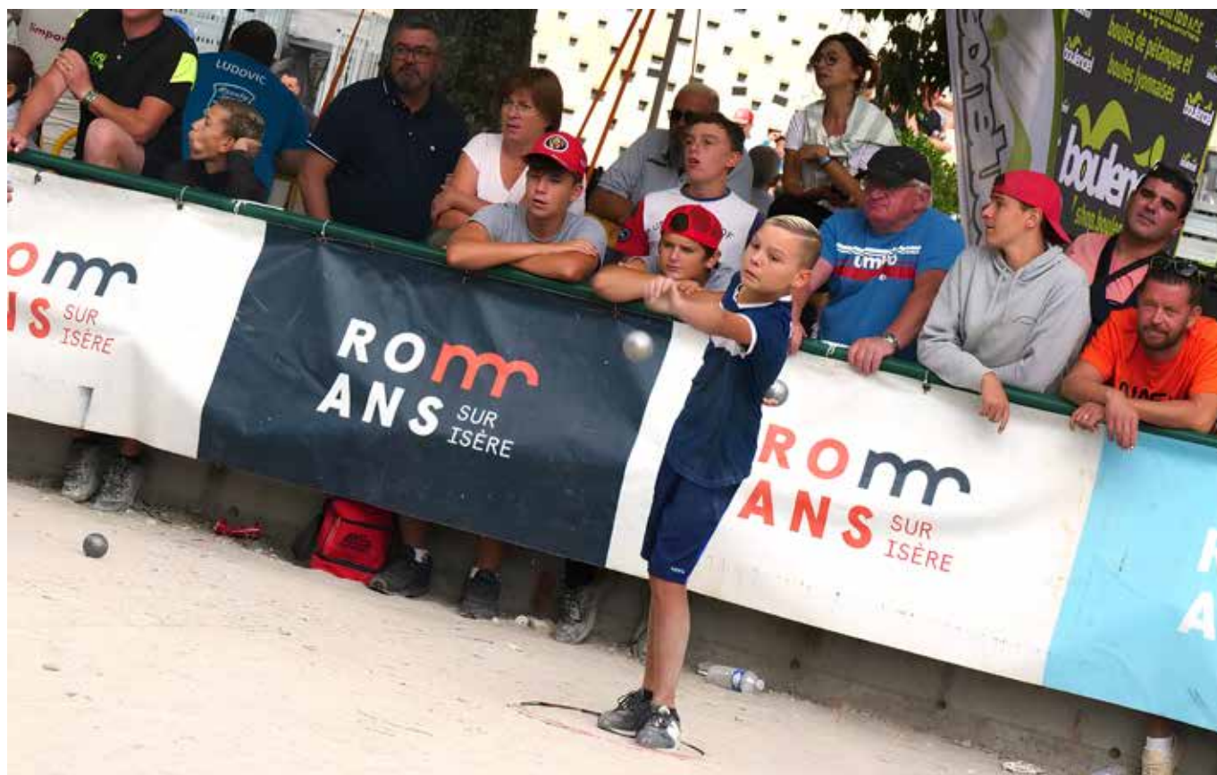
La ville de Romans-sur-Isère, soutien numéro 1 de la pétanque et du Mondial des Jeunes.

Place forte de la pétanque en France, Romans-sur-Isère a vibré au cœur du mois d'août. Avant la réception d'une étape des Masters, avec les stars de la discipline, la cité drômoise a basculé 100% pétanque pendant la Semaine du Mondial de Romans. Quatre jours étaient entièrement dédiés aux jeunes, de 6 à 17 ans, avec les pépites d'aujourd'hui et grands de demain.