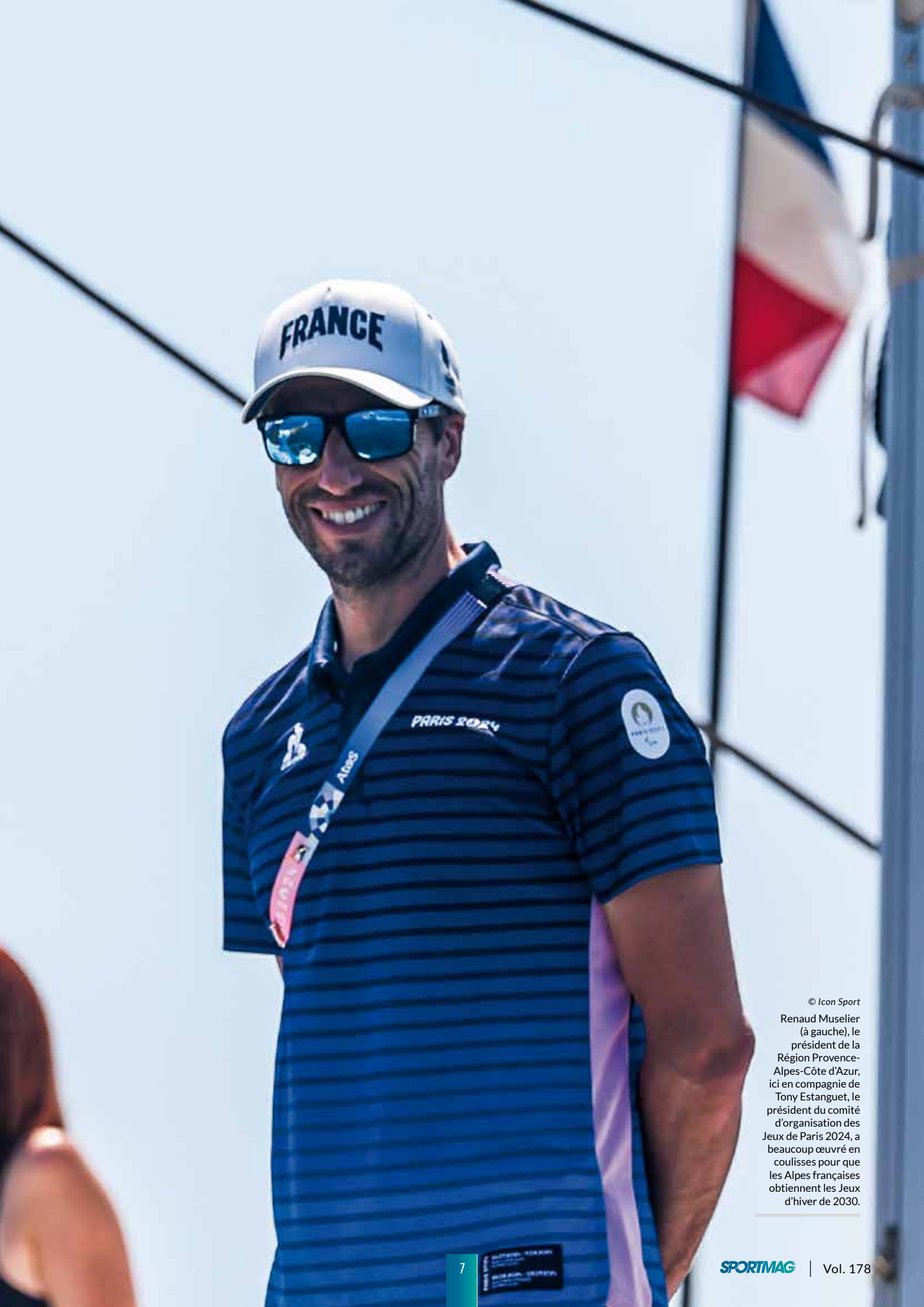
Renaud Muselier (à gauche), le président de la Région Provence-Alpes-Côte d'Azur, ici en compagnie de Tony Estanguet, le président du comité d'organisation des Jeux de Paris 2024, a beaucoup œuvré en coulisses pour que les Alpes françaises obtiennent les Jeux d'hiver de 2030.