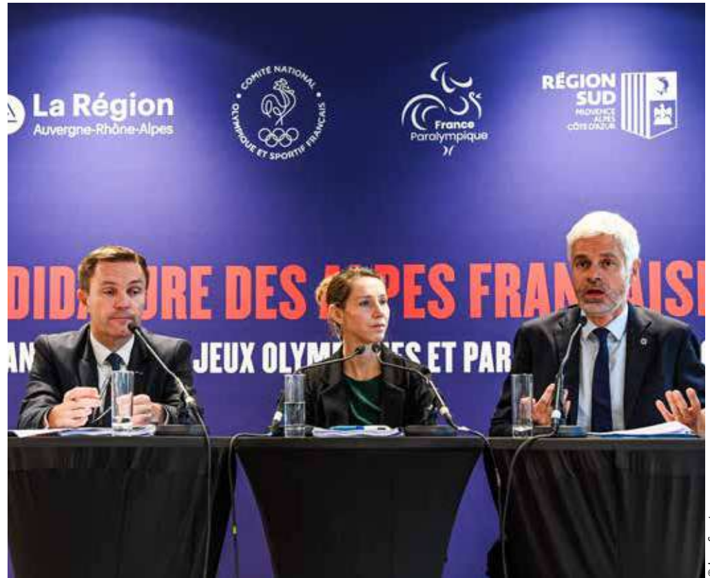
Laurent Wauquiez (à droite), l'ancien président de la Région Auvergne-Rhône-Alpes, a fait cause commune avec son homologue de Provence-Alpes-Côte d'Azur, Renaud Muselier, pour obtenir les Jeux d'hiver 2030 avec le soutien de David Lappartient, président du comité national olympique et sportif français, et Marie-Amélie Le Fur, présidente du comité paralympique et sportif français.

J'ai été fasciné par la cérémonie d'ouverture, même si tous les tableaux ne me