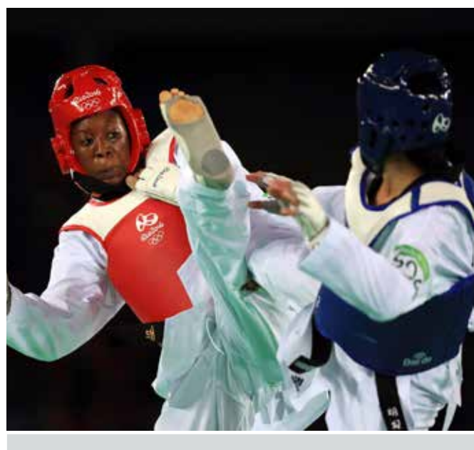
Vice-championne olympique de taekwondo en 2016 chez les moins de 67 kilos, Haby Niaré fait partie des athlètes cités dans le livre de Simone Thiero pour illustrer les séquelles que peut laisser le sport de haut niveau.