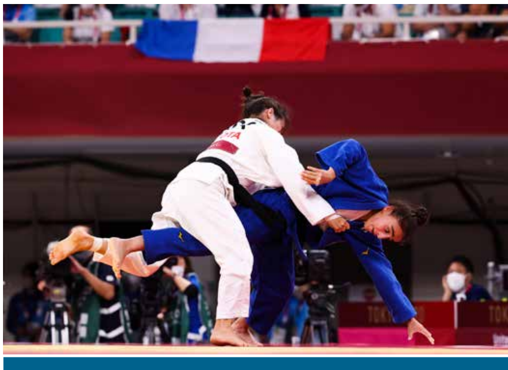
Très en vue aux Jeux paralympiques, le para judo est une pratique en plein développement.