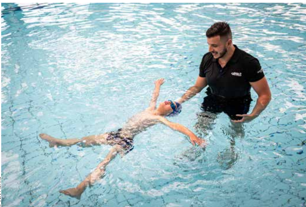
Les maîtres-nageurs sont formés afin d'accompagner au mieux les jeunes membres de l'Académie des p'tits nageurs.

Différents niveaux qui permettent d'homogénéiser les groupes au sein de cette Académie des p'tits nageurs. « Sur les deux premiers niveaux, nous sommes sur des notions d'âge. Le jar-