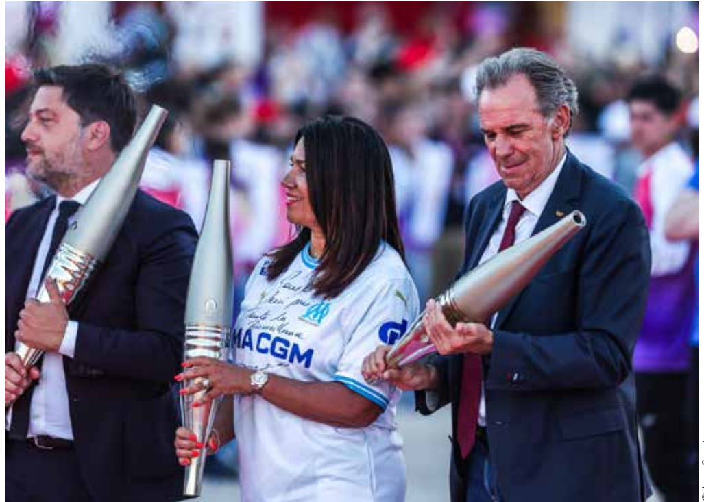
C'est à Marseille que la flamme olympique a fait son arrivée sur le sol français le 8 mai 2024. Sept ans après l'attribution des Jeux de 2024 à la France, le rêve olympique est devenu encore plus concret pour les élus de Provence-Alpes-Côte d'Azur comme Benoît Payan, le maire de Marseille, Samia Ghali, maire-adjointe de Marseille et conseillère départementale, ainsi que Renaud Muselier, président de la Région Provence-Alpes-Côte d'Azur.

C'est un mixte entre le politique et le sportif à l'image du duo Michel Barnier-Jean-Claude Killy pour les Jeux d'Albertville en 1992. Pour 2030, ce sera diffé-