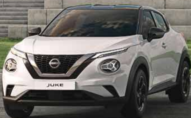
Nissan Juke suréquipé