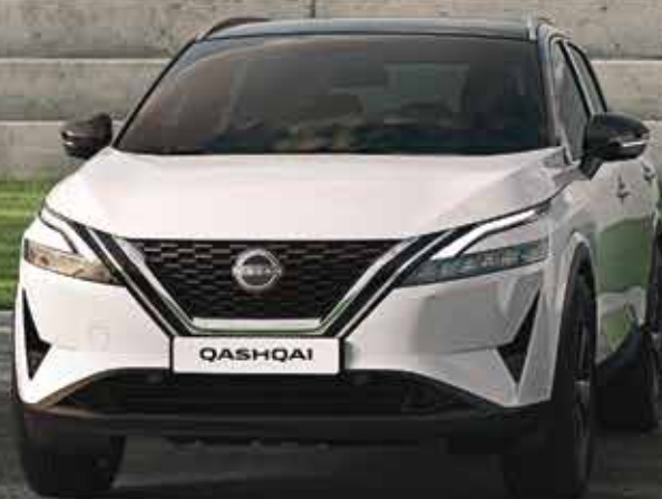
Nissan Qashqai suréquipé

Gamme à partir de 149€ par mois* 1 er loyer de 4 900€ sans condition