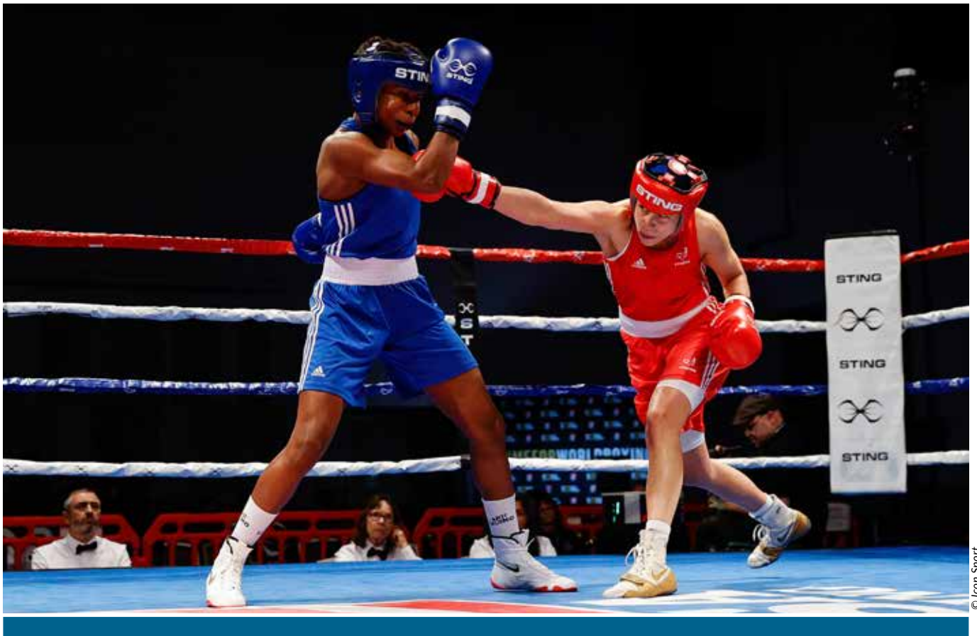
La boxeuse de la Team SPORTMAG a multiplié les stages à l'étranger pour être prête pour le rendez-vous de Paris 2024.

tout le combat. Avant, ça ne m'arrivait jamais d'avoir ce type d'adversaire, révèle la Havraise. Désormais, je sens que j'inquiète de plus en plus